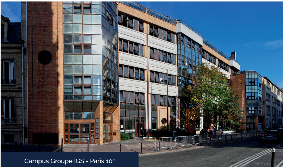
Campus Groupe IGS - Paris 10 e