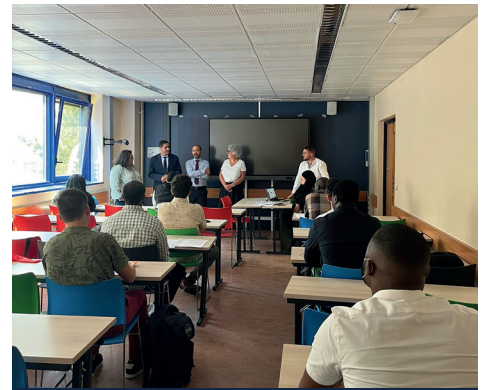
JOB DATING Prodistribution - Juin 2023