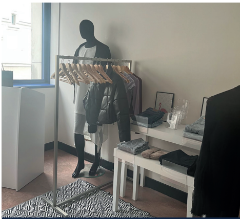
Notre magasin d'application 7, rue Pierre Dupont, 75010 Paris